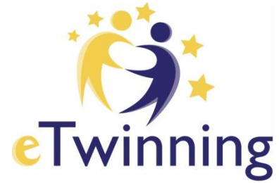
Foto:Tanışma1, 2, 3