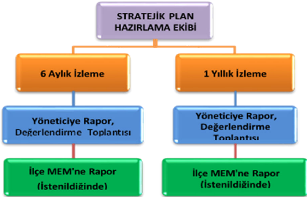
Şekil 3: İzleme ve Değerlendirme Süreci

Müdürlüğümüzün 2019-2023 Stratejik Planı İzleme ve Değerlendirme sürecini ifade eden İzleme ve Değerlendirme Modeli hazırlanmıştır. Müdürlüğümüzün Stratejik Plan İzleme- Değerlendirme çalışmaları eğitim-öğretim yılı çalışma takvimi de dikkate alınarak 6 aylık ve 1 yıllık sürelerde gerçekleştirilecektir. 6 aylık sürelerde rapor hazırlanacak ve değerlendirme toplantısı düzenlenecektir. İzleme-değerlendirme raporu, istenildiğinde İlçe Millî Eğitim Müdürlüğü'ne gönderilecektir. Ayrıca ilçemizin Mülki İdari Amirine sunulacaktır. 1 yıllık izleme-değerlendirme çalışmaları, Stratejik Planımızda yer alan hedeflerin yıllık düzeyde ifade edildiği Performans Programı ve yılsonunda gerçekleşme düzeylerinin belirlendiği Faaliyet Raporu hazırlanarak yapılacaktır.